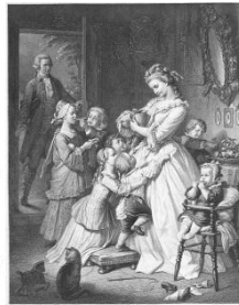
社名の由来である “若きウェルテルの悩み”のヒロイン 「シャルロッテ」